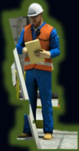
ผู้อนุญาต