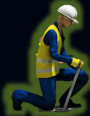
ผู้ควบคุม