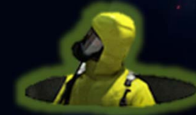
ผู้ปฏิบัติงาน