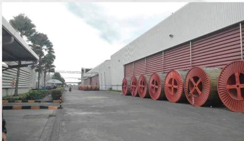
รูปภาพที่ ๔ และ ๕ แสดงพื้นที่บริเวณสถานที่เกิดอุบัติเหตุ