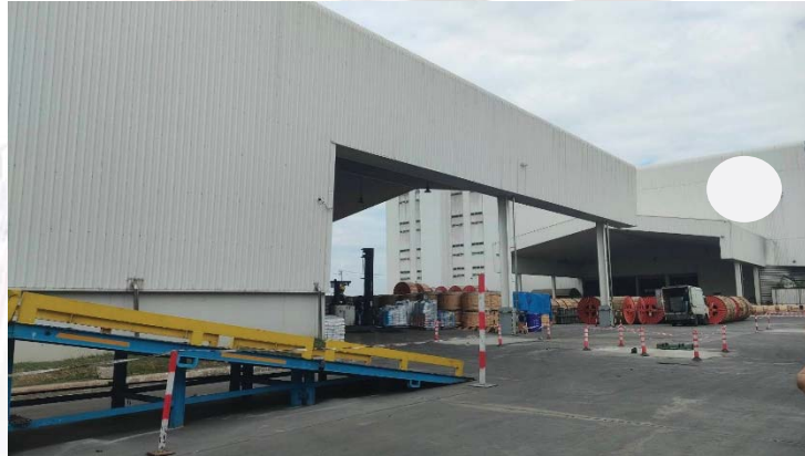
รูปภาพที่ ๑๔ แสดงจุดที่มีการเบิกวัสดุและจุดที่โหลดสินค้าเข้าคลังสินค้า

๔.๒.๑ ในการเบิกวัสดุจากคลังสินค้า กระทำพร้อมกับงานโหลดสินค้าเข้าคลัง ซึ่งอยู่บริเวณใกล้กัน