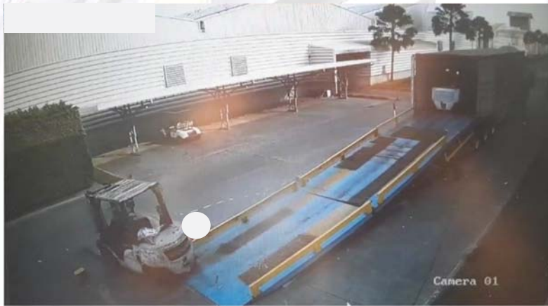
๔. ลูกจ้างตกลงมาจากรถกระแทกลงกับพื้น เนื่องจากขณะขับรถลูกจ้างไม่ได้คาดเข็มขัดนิรภัย