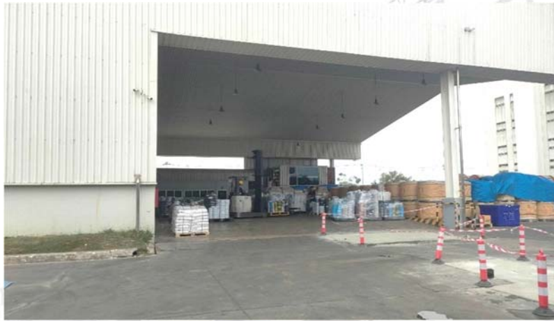
รูปภาพที่ ๓ แสดงบริเวณหน้าอาคารคลังสินค้า