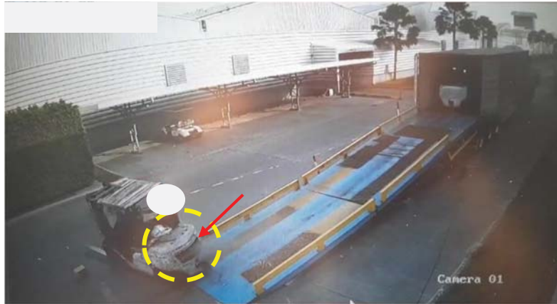
๓. ทำयरถยกสะบัดและชนกับราวกันตกของ Slope