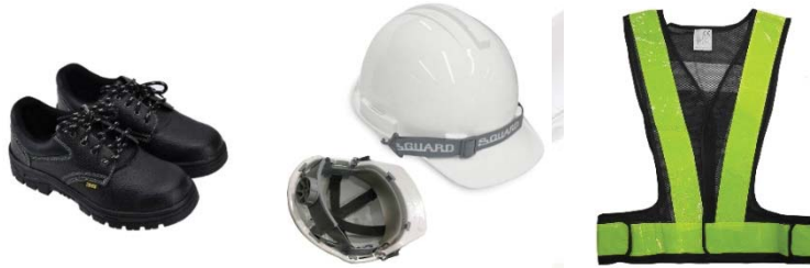
รูปภาพที่ ๒ แสดงภาพเครื่องมือ และอุปกรณ์ที่ใช้ในการทำงาน