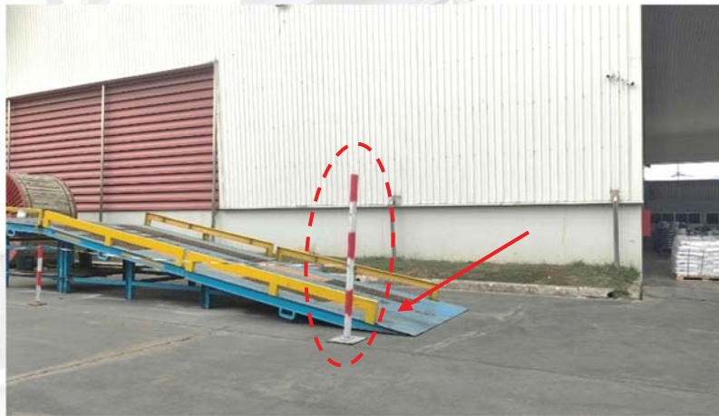
รูปภาพที่ ๒ แสดงบริเวณจุดไหลดงาน (บริเวณที่เกิดอุบัติเหตุ)