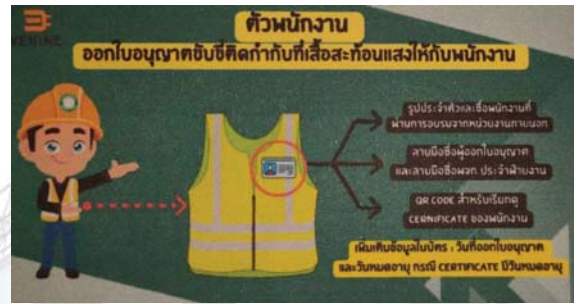
รูปภาพที่ ๑๕ แสดงตัวอย่างการแสดงผลการเป็นพนักงานขับรถยก