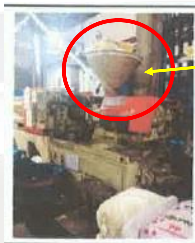
จุดเทเม็ดพลาสติก