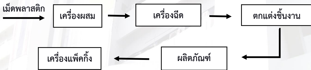
ภาพที่ ๑ แสดงกระบวนการผลิตพลาสติก

กระบวนการผลิตของบริษัทฯ เป็นการขึ้นรูปพลาสติกด้วยการฉีด Injection Molding ซึ่งมีขั้นตอนคือ นำวัตถุดิบเม็ดพลาสติกหรือเป็นผงลงในกรวยเติม (Hopper) จะถูกเกลียวหนอนหมุนส่งไปยังด้านหน้าของกระบอกลูกสูบ ซึ่งมีแผ่นความร้อนไฟฟ้า (Electrical Heater) ทำให้พลาสติกหลอมเหลว หลังจากนั้นจะเคลื่อนเกลียวหนอนให้ดันพลาสติกผ่านหัวฉีดเข้าแม่พิมพ์ (Mold) ซึ่งปิดอยู่แม่พิมพ์ซึ่งจะมีการหล่อเย็นด้วยน้ำเย็นที่ผลิตจากเครื่องทำน้ำเย็น (Chiller) เพื่อให้ชิ้นงานพลาสติกเย็นและพลาสติกแข็งตัวสามารถถอดออกจากแบบได้ในระยะเวลาสั้น จากนั้นจะส่งไปตกแต่งชิ้นงานต่อไป