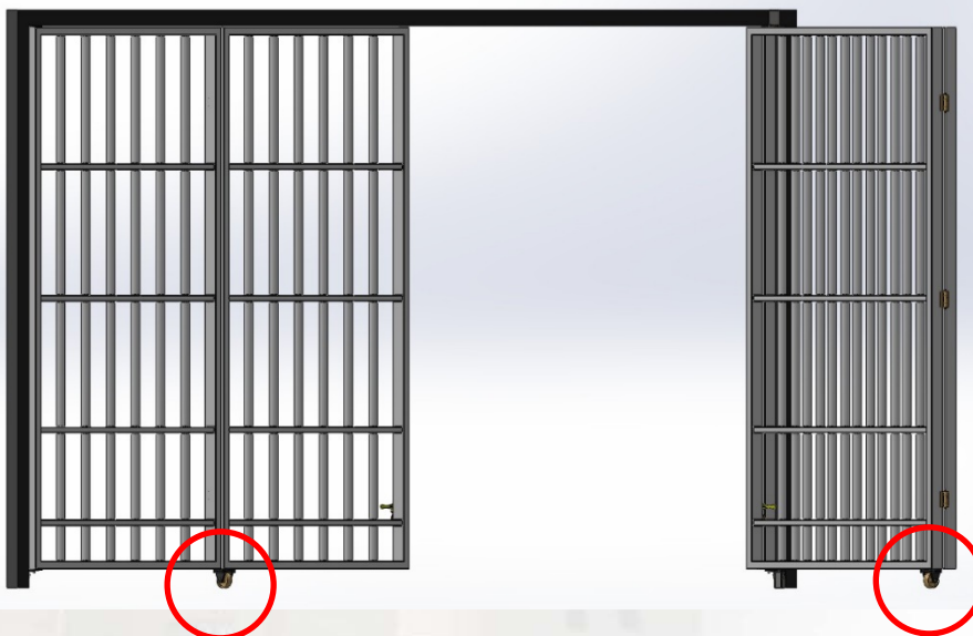
รูปภาพที่ ๓ ลักษณะการติดตั้งล้อประตูเหล็กบานพับ