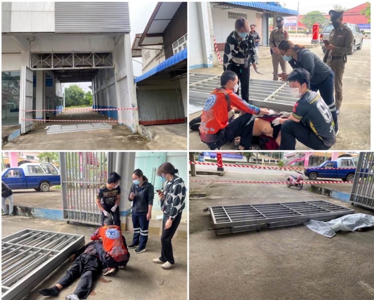
รูปภาพที่ ๒ การเข้าตรวจสอบผู้เสียชีวิตและสภาพพื้นที่หลังเกิดอุบัติเหตุ

เจ้าหน้าที่ตำรวจได้ตรวจสอบที่เกิดเหตุ พบว่า ประตูดังกล่าวเป็นประตูเหล็กขนาดใหญ่ มีน้ำหนักมาก แต่สลักประตูมีขนาดเล็ก ประกอบกับเป็นประตูเก่า มีสนิมและเกิดการผุกร่อนจากการใช้งานมานาน ประตูจึงล้มลงมาทับนาย พ เสียชีวิต โดยผลชันสูตรเบื้องต้นของโรงพยาบาลพบว่าผู้เสียชีวิตมีรอยถูกทับบริเวณหน้าอกและแขน