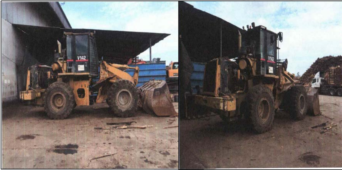
รูปภาพรถดักที่ถอยทับพนักงาน

๓. รายละเอียดการประสบอันตรายหรือความสูญเสียหรือหยุดการผลิตจากอุบัติเหตุ