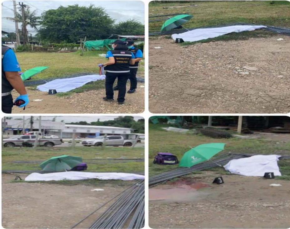
รูปภาพ สถานที่เกิดเหตุ