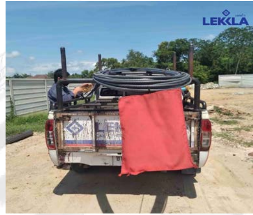
การใช้เครื่องมือ เครื่องจักรให้เหมาะสมกับลักษณะของงาน