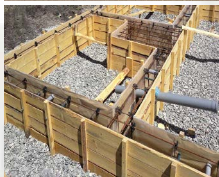
ลักษณะการประกอบกิจการของนายจ้าง