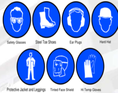
การใช้อุปกรณ์คุ้มครองความปลอดภัยเพื่อลดความรุนแรงของอุบัติเหตุ รูปภาพ การแก้ไขเพื่อป้องกัน