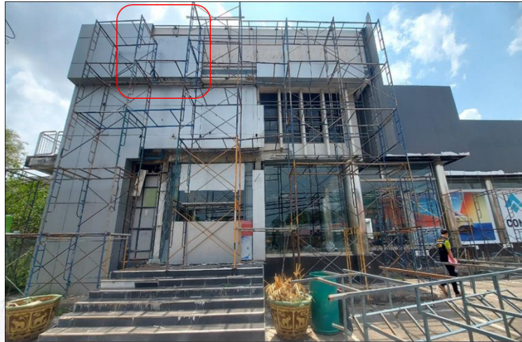
ภาพที่ ๓ แสดงบริเวณส่วนประกอบของนั่งร้านที่พลัดตกลงมา