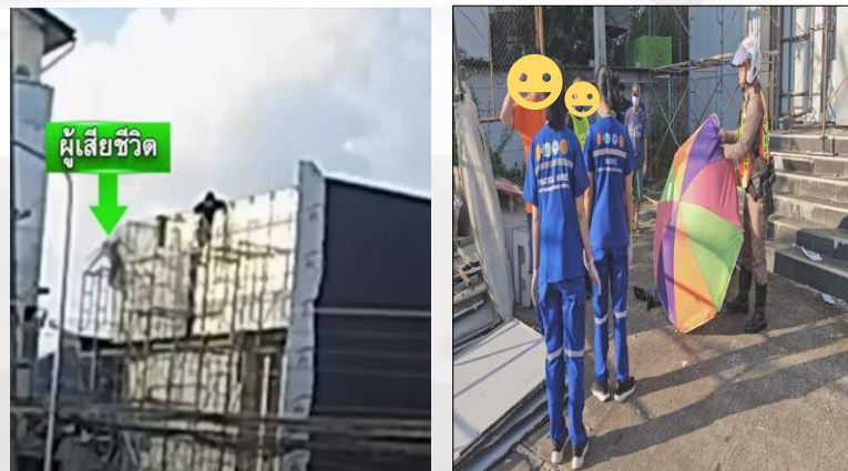
ภาพที่ ๒ แสดงจุดเกิดเหตุ