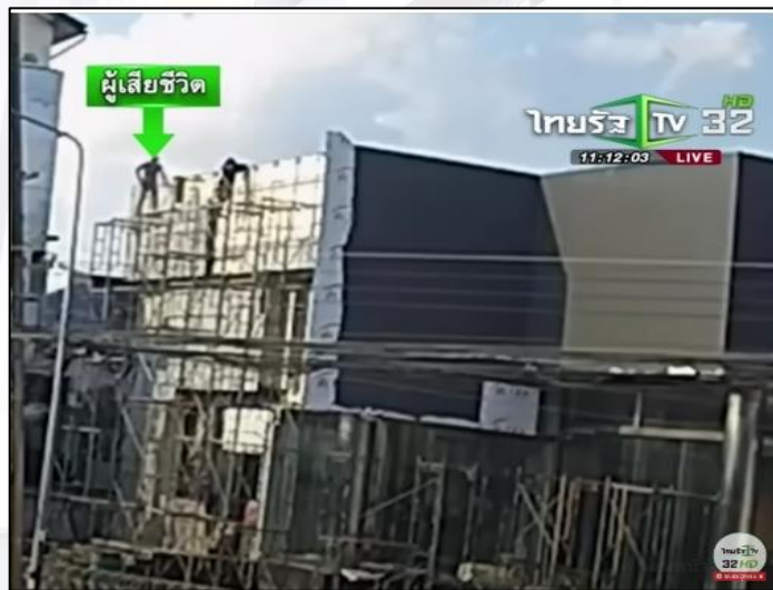
ภาพที่ ๑ แสดงจุดเกิดอุบัติเหตุ

วันที่ ๘ พฤษภาคม ๒๕๖๗ นาย A หัวหน้างาน นาย B ตำแหน่งช่างเชื่อม พร้อมกับเพื่อนร่วมงานจำนวน ๖ คน เข้าทำการปรับปรุงอาคารโชว์รูมรถยนต์ ส่วนของการติดตั้งโครงเหล็กและแผ่นอลูมิเนียมคอมโพสิต ผนัง ฝ้าเพดานรอบนอกอาคารโชว์รูมรถยนต์ โดยมีการนำนั่งร้านมาใช้งาน นาย A กับพวกรวม ๖ คน ช่วยกันประกอบและติดตั้งนั่งร้าน การขึ้นไปปฏิบัติงานบนนั่งร้าน ใช้วิธีปีนป่ายขึ้นไปตามชั้นของนั่งร้าน มีอุปกรณ์คุ้มครองความปลอดภัยส่วนบุคคล เช่น เข็มขัดนิรภัย สายช่วยชีวิต ต่อมาวันที่ ๑๔ พฤษภาคม ๒๕๖๗ เวลาประมาณ ๑๖.๒๐ น. นาย B กับเพื่อนร่วมงาน ๑ คน (นาย C) กำลังปฏิบัติงานบนนั่งร้านที่มีความสูงจากพื้นดิน ๑๐ เมตร เพื่อติดตั้งแผ่นอลูมิเนียมคอมโพสิตบริเวณด้านหน้าอาคารโชว์รูมรถยนต์ ขณะที่นาย B เดินอยู่บนนั่งร้าน โดยไม่สวมใส่เข็มขัดนิรภัยหรือยึดโยงสายช่วยชีวิตกับจุดที่มั่นคงแข็งแรงกับตัวอาคารได้เหยียบฝากรอบนั่งร้านและพลัดตกลงมาด้านล่างพร้อมกับฝากรอบนั่งร้าน เป็นเหตุให้ร่างตก กระแทกพื้นเสียชีวิตในที่เกิดเหตุ