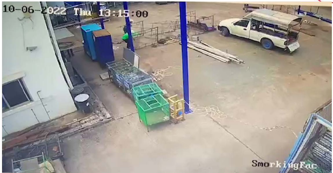
ภาพที่ ๘ เวลา ๑๓.๑๕ น. นายฉัฐพงษ์ฯ ที่อยู่ด้านบนของนั่งร้าน ตกลงมาพร้อมกับนั่งร้าน