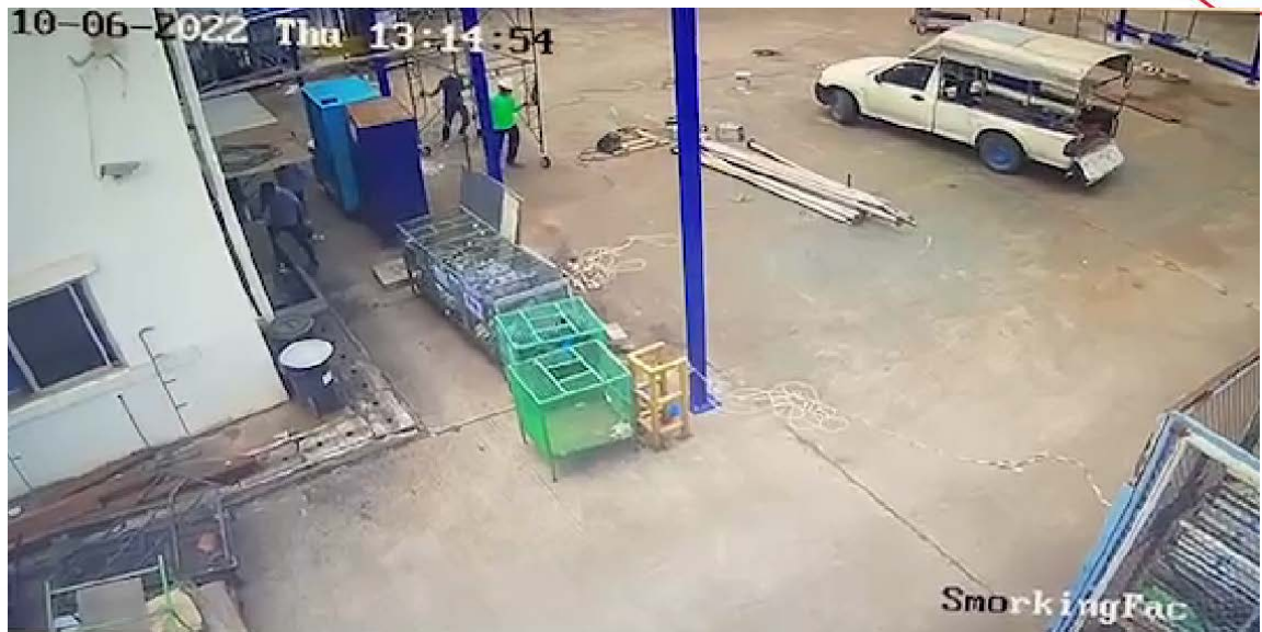
ภาพที่ ๖ เวลา ๑๓.๑๔ น. ลูกจ้างของบริษัท ก จำกัด พยายามเคลื่อนย้ายนั่งร้านแต่ล้อของนั่งร้านเกิดติดขัดกับสายไฟ