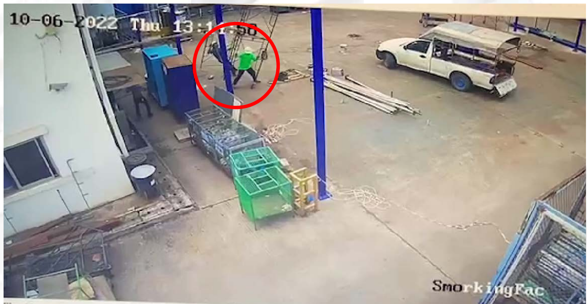
ภาพที่ ๗ เวลา ๑๓.๑๕ น. นั่งร้านเสียสมดุลและล้มเทไปยังด้านขวาของมุกกล้อง