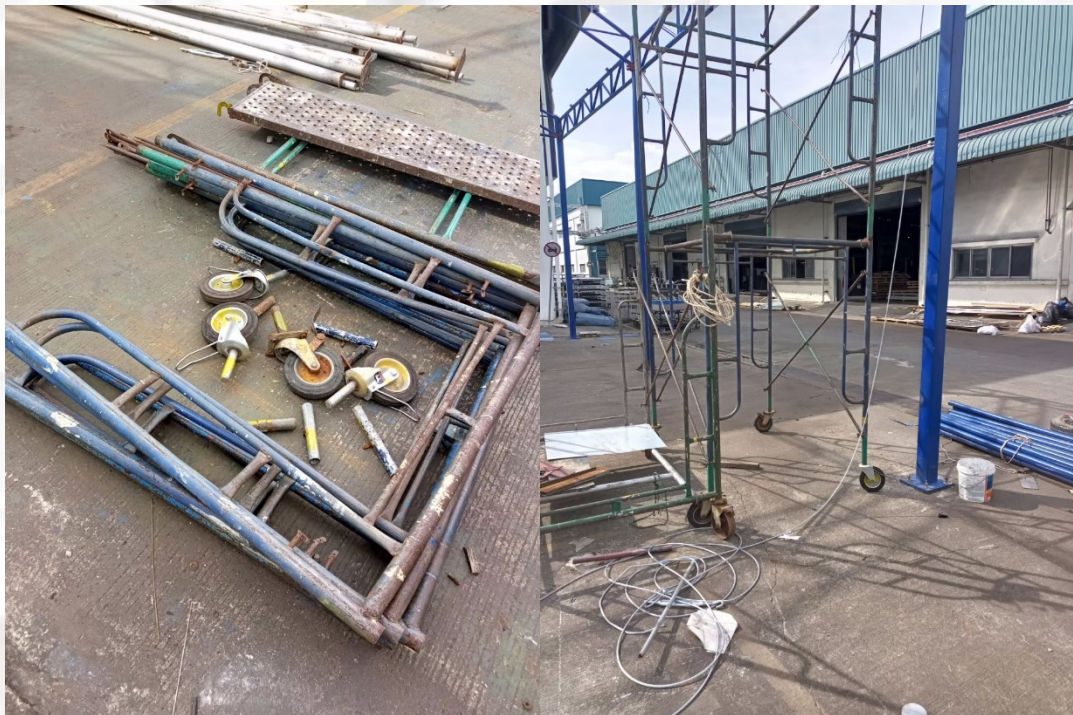
ภาพที่ ๑ (ซ้าย) นั่งร้านที่เกิดเหตุ (ขวา) นั่งร้านลักษณะเดียวกันกับนั่งร้านที่ใช้ในที่เกิดเหตุ นั่งร้านทั้งสองเป็นนั่งร้านของบริษัท จ จำกัด

นั่งร้านโครงสร้างเหล็กญี่ปุ่น (“A” Flame Type) ชนิดแบบมีล้อเลื่อนและมีห้ามล้อถอดประกอบได้