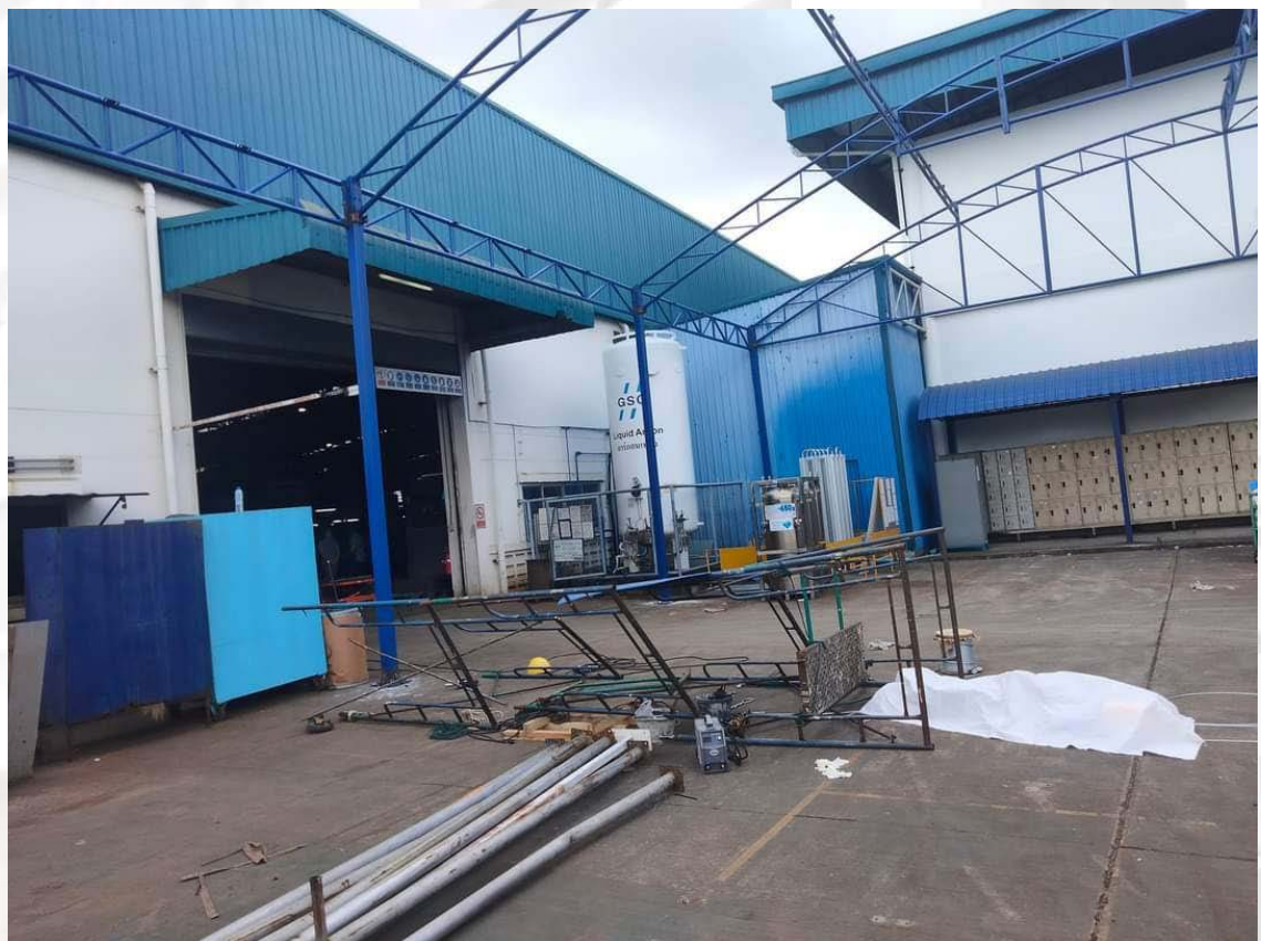
ภาพที่ ๙ ที่เกิดเหตุ