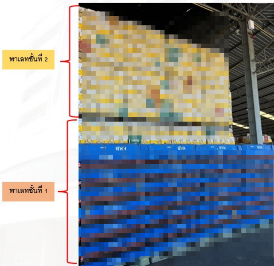
รูปภาพแสดงการวางเรียงกล่องลังเปียร์ และการวางพาเลท