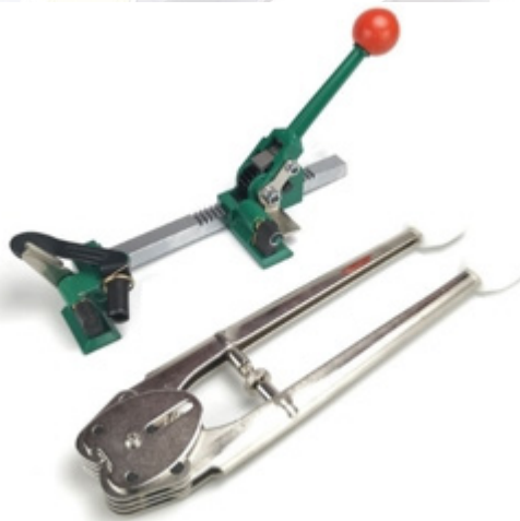
ภาพตัวอย่างอุปกรณ์ที่ใช้ในการทำงาน