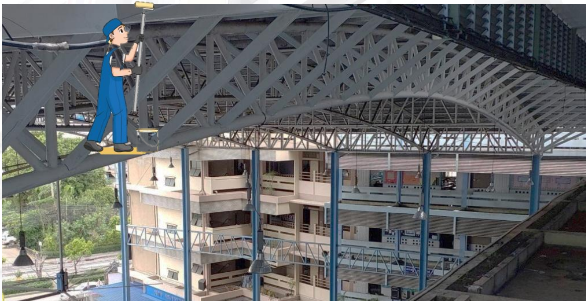
ภาพที่ ๒.๓.๑ ภาพจำลองเหตุการณ์