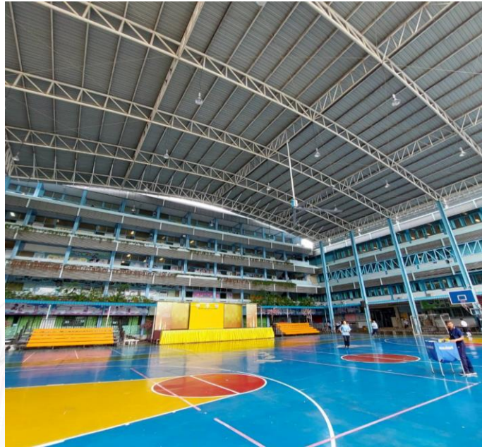
ภาพที่ ๒.๑.๑ สภาพอาคารลานอเนกประสงค์ที่ลูกจ้างปฏิบัติงาน