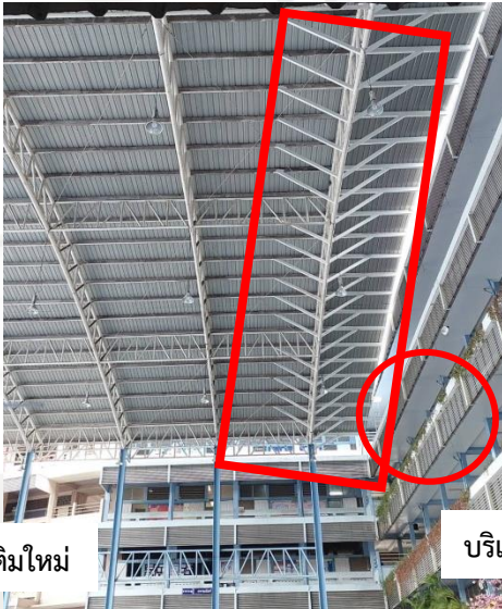
บริเวณที่ต่อเติมใหม่