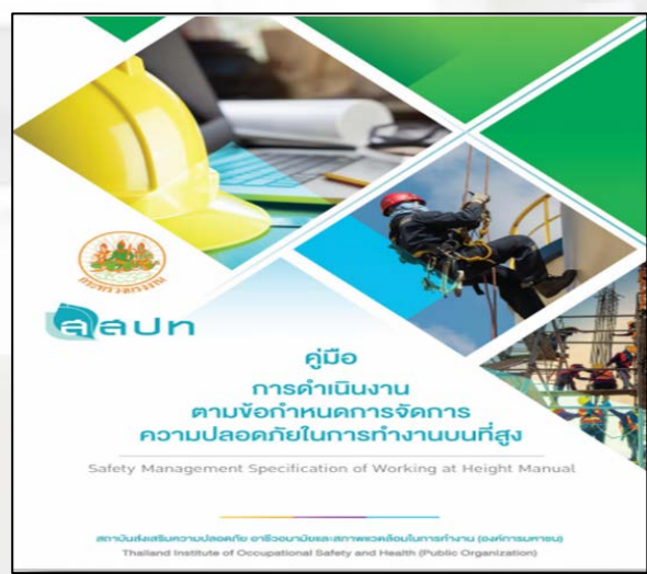
ภาพที่ ๔ คู่มือความปลอดภัยในการทำงานบนที่สูง