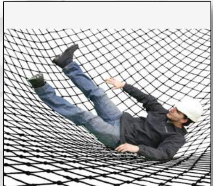
ภาพที่ ๒ แสดงการติดตั้งนั่งร้าน ตาข่ายนิรภัย

๕.๒ ข้อเสนอแนะหรือมาตรการแก้ไขปัจจัยด้านคน/การกระทำที่ไม่ปลอดภัย