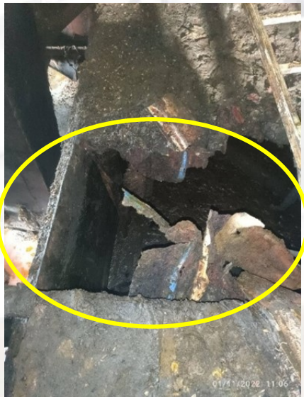
รูปภาพแสดงการเกิดอุบัติเหตุ และภาพจำลองเหตุการณ์ (ระบุจุดเกิดเหตุ แสดงถึงลักษณะการเกิดอุบัติเหตุได้ชัดเจน)

เวลาประมาณ ๐๗.๕๐ น. เกิดเหตุการณ์ ดังนี้ เพื่อนพนักงานช่วยเหลือโดยการเปิดระบายของเหลวภายในถังออก แล้วลงไปช่วยเหลือนาย อ. ขึ้นมาจากถังแยกน้ำมันปาล์ม แต่นาย อ. หมดสติ จึงนำตัวส่งโรงพยาบาล นาย อ. เสียชีวิตในเวลาต่อมา แพทย์ระบุสาเหตุการเสียชีวิตว่า ฆีวหนังใหม่..... อย่างรุนแรง