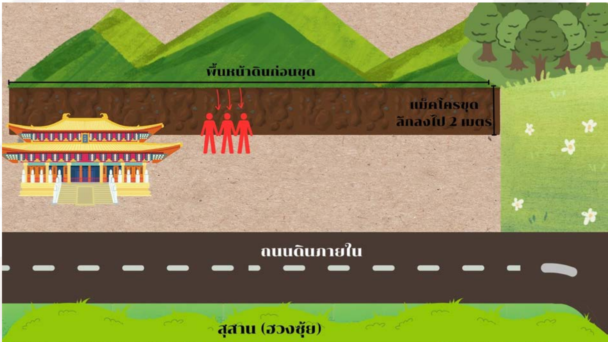
รูปภาพจำลองเหตุการณ์การเกิดอุบัติเหตุ