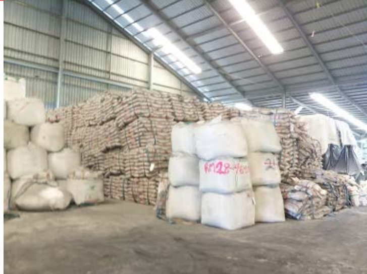
รูปที่ ๑-๑ แสดงสภาพอาคารคลังสินค้า สถานที่เกิดอุบัติเหตุ