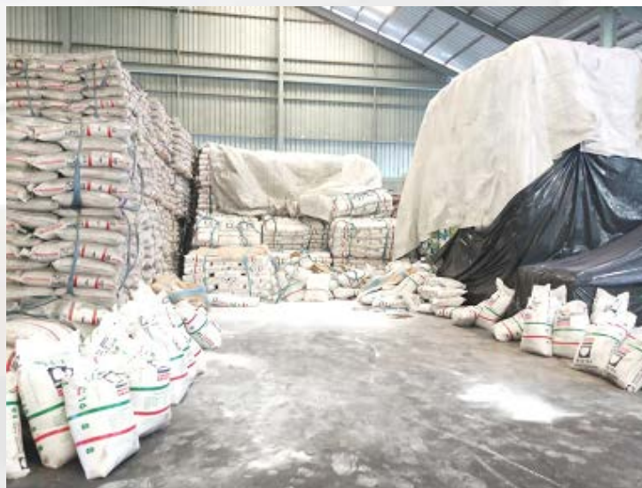
รูปที่ ๓-๑ แสดงภาพกองปุ๋ย ณ จุดเกิดอุบัติเหตุ

เวลา ๒๑.๓๐ น. นาย ช ได้เดินกลับมายังกองปุ๋ยเพื่อรถยกมาเคลื่อนย้ายปุ๋ยแต่รถยกยังไม่ถึง ขณะยืนหันหลังอยู่บริเวณกองปุ๋ย ได้เกิดเหตุกระสอบพรีสลิงบรรจุปุ๋ยพังทลายลงมาทับลูกจ้างจากชั้นที่ ๔ ขนาดน้ำหนักที่พังทลายลงมาประมาณ ๑,๗๕๐ กิโลกรัม ทำให้ลูกจ้างเสียชีวิตทันทีที่เกิดเหตุ ซึ่งในขณะที่ลูกจ้าง ปฏิบัติงานนั้นมิได้สวมใส่อุปกรณ์คุ้มครองความปลอดภัยส่วนบุคคลตามลักษณะงานแต่อย่างใด อีกทั้งในเวลาที่เกิด อุบัติเหตุเป็นเวลาปฏิบัติงานล่วงเวลาจึงทำให้ลูกจ้างอยู่ในที่เกิดเหตุแต่เพียงผู้เดียว และบริเวณสถานที่ทำงานมีแสง สว่างไม่เพียงพอ