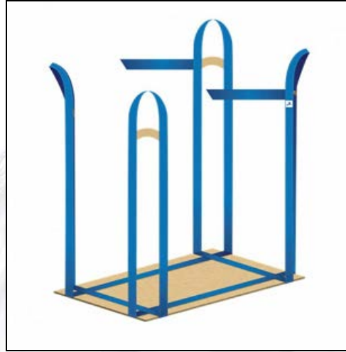
รูปที่ ๒-๑ แสดงลักษณะของถูงพรีสลิ้ง

เครื่องจักรการทำงานอื่นๆ ที่เกี่ยวข้องกับการเกิดอุบัติเหตุ คือ รถยก (Forklift)