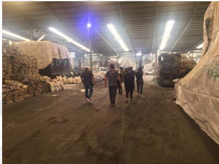
รูปที่ ๑-๒ แสดงสภาพอาคารคลังสินค้า สถานที่เกิดอุบัติเหตุ