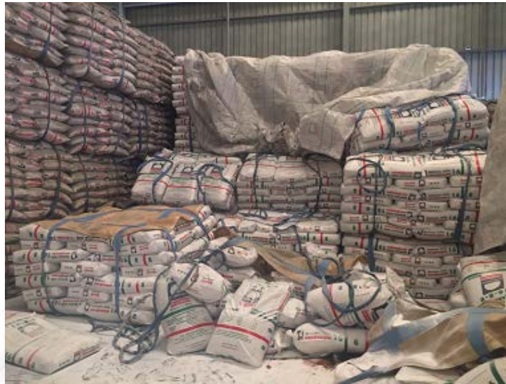
รูปที่ ๓-๒ แสดงภาพกองปุ๋ย ณ จุดเกิดอุบัติเหตุ