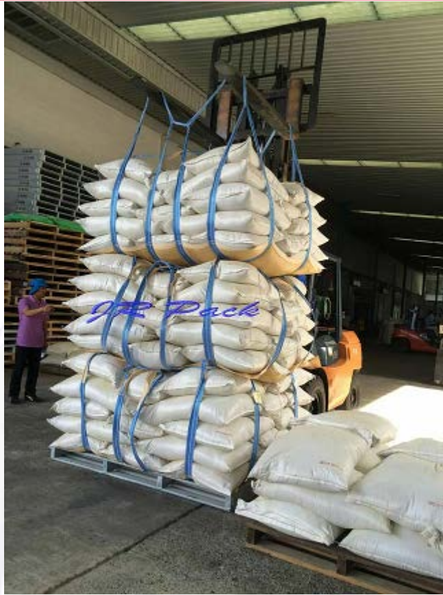
รูปที่ ๒-๓ แสดงตัวอย่างลักษณะการเคลื่อนย้ายถุงฟรีสลิงโดยรถยก