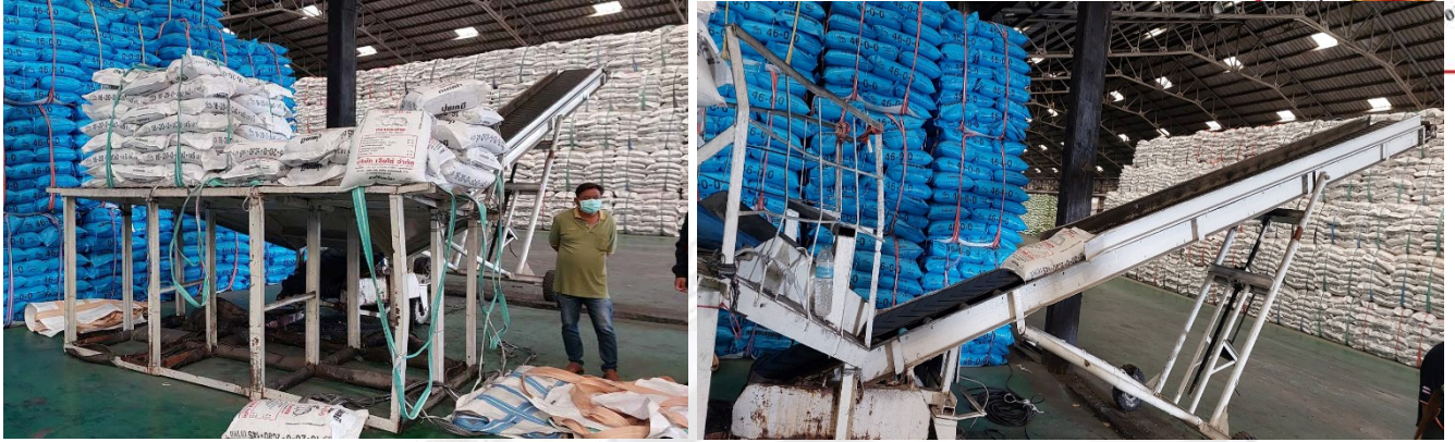
รูปที่ ๒ แสดงลักษณะของแท่นจ่ายปุ๋ยเคมี

๒.๒ ลักษณะการทำงานของลูกจ้างก่อนที่จะเกิดอุบัติเหตุ