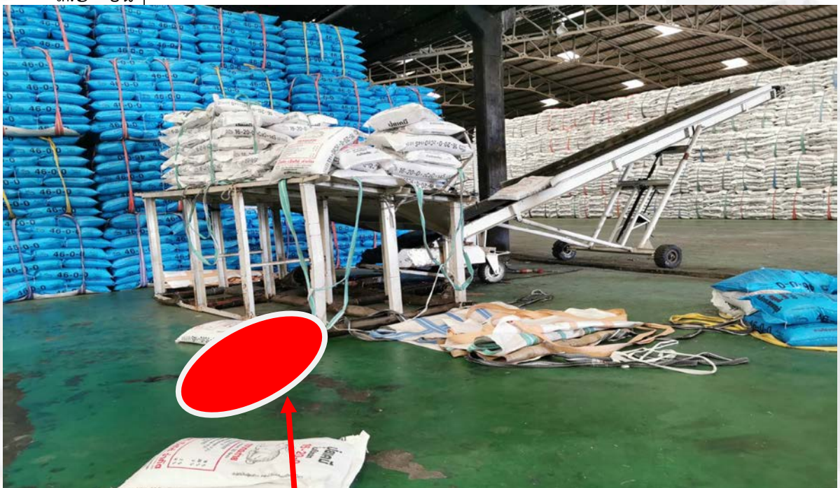
รูปภาพที่ ๔ แสดงจุดที่ลูกจ้างตกจากแท่นจ่ายปุ๋ยเคมีเสียชีวิต