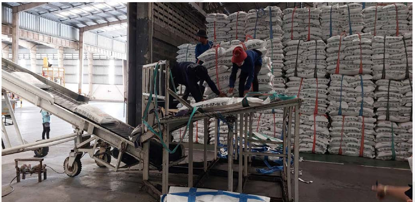
รูปที่ ๓ แสดงลักษณะการทำงานบนแท่นจ่ายปุ๋ยเคมี

- ลูกจ้างพร้อมเพื่อนร่วมงาน จำนวน ๖ คน ได้รับมอบหมายให้ดำเนินการขนถ่ายปุ๋ยเคมีขึ้นรถบรรทุก โดยใช้แท่นจ่ายปุ๋ยเคมีในการทำงาน ซึ่งในการทำงานจะมีการแบ่งหน้าที่ คือ ลูกจ้างที่ทำหน้าที่เรียงปุ๋ยเคมีบนรถบรรทุก จำนวน ๓ คน ลูกจ้างทำหน้าที่ถอดสายรัดกระสอบปุ๋ยและดึงกระสอบปุ๋ยเคมีใส่ในสายพานลำเลียงบนแท่นจ่ายปุ๋ยเคมี จำนวน ๒ คน และลูกจ้างอยู่ด้านล่างทำหน้าที่เก็บสายรัดกระสอบปุ๋ยและทำความสะอาด จำนวน ๑ คน โดยลูกจ้างที่เสียชีวิต ได้ปฏิบัติหน้าที่อยู่บนแท่นจ่ายปุ๋ยเคมี ซึ่งลักษณะเป็นโครงสร้างเหล็ก พื้นที่ด้านข้างเปิดโล่ง มีขนาดความสูง ๑.๖๐ เมตร ความกว้าง ๓.๖๐ เมตร ความยาว ๒.๕๐ เมตร โดยทำหน้าที่ถอดสายรัดกระสอบและดึงกระสอบปุ๋ยเคมีใส่ในสายพานลำเลียง เพื่อนำขึ้นไปใส่ในรถบรรทุก