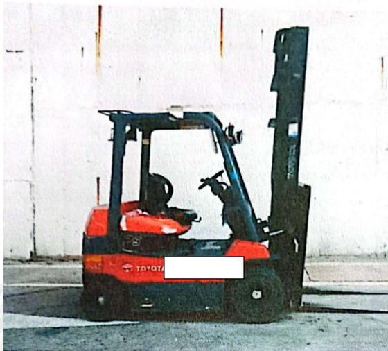
รูปแสดงรถยกที่ผลิตปี ๒๐๑๒ ที่ใช้สำหรับการขนย้ายวัสดุ