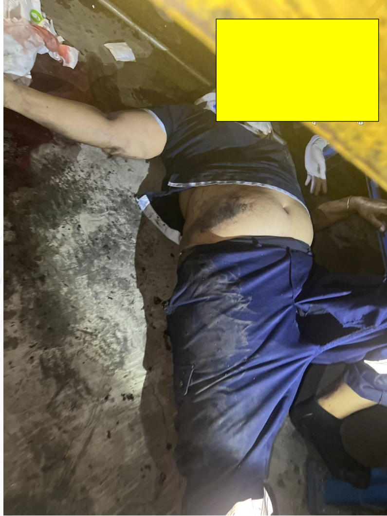
รูปที่ ๗ ทำการปฐมพยาบาลเบื้องต้นให้กับลูกจ้าง