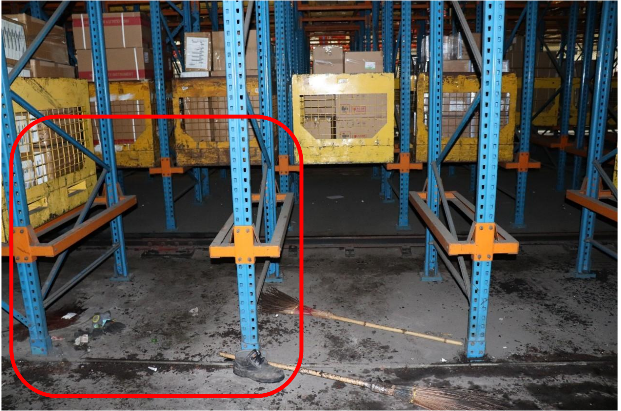
รูปที่ ๕ จุดที่ลูกจ้างประสบอุบัติเหตุ