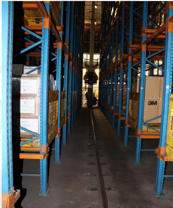
รูปที่ ๔ จุดนี้คือบริเวณพื้นที่ด้านข้างถัดจากพื้นที่ที่ลูกจ้างเข้าไปทำความสะอาด จะมี Stracker Crane ปฏิบัติงานวิ่งเคลื่อนที่ไปมาบนรางวิ่ง