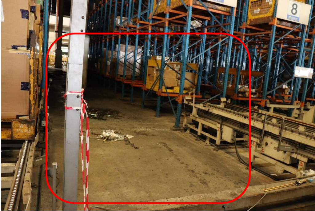
รูปที่ ๓ พื้นที่ภายในที่ลูกจ้างเข้าไปทำความสะอาด