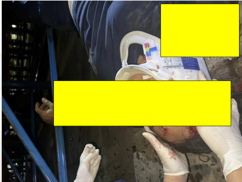
รูปที่ ๖ ทำการปฐมพยาบาลเบื้องต้นให้กับลูกจ้าง